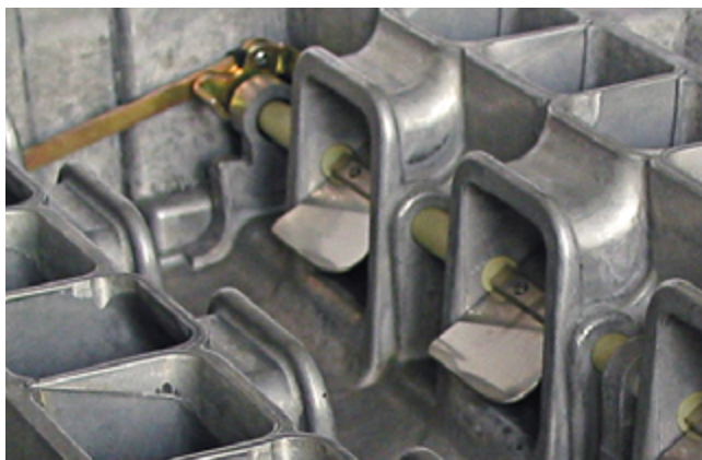
Ein Blick in das Innere eines Schaltsaugrohrs